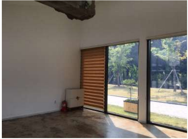
4동 예술동 - 시민기획스튜디오 내부 공간 ( 30m 2 )